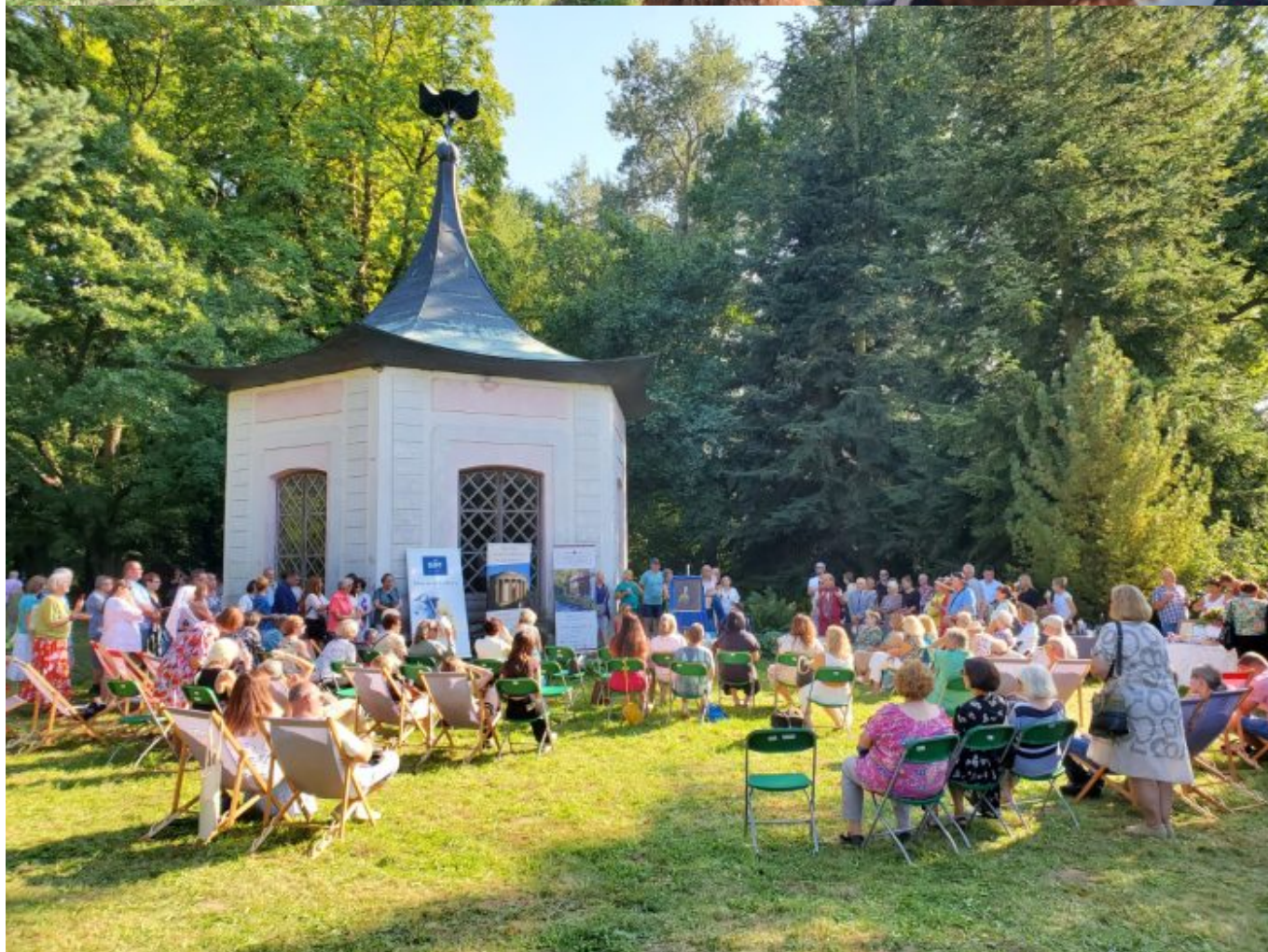
Księżna Czartoryska jest nieustającym źródłem do podejmowania różnych działań i ten właśnie