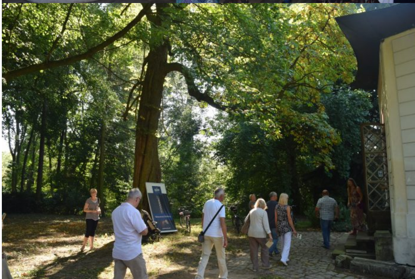
We wnętrzu Altany Chińskiej umieszczony jest oryginalny marmurowy posąg Tankreda i Kloryndy oraz zabytkowe fragmenty małej architektury ogrodowej, natomiast na zewnątrz można zobaczyć