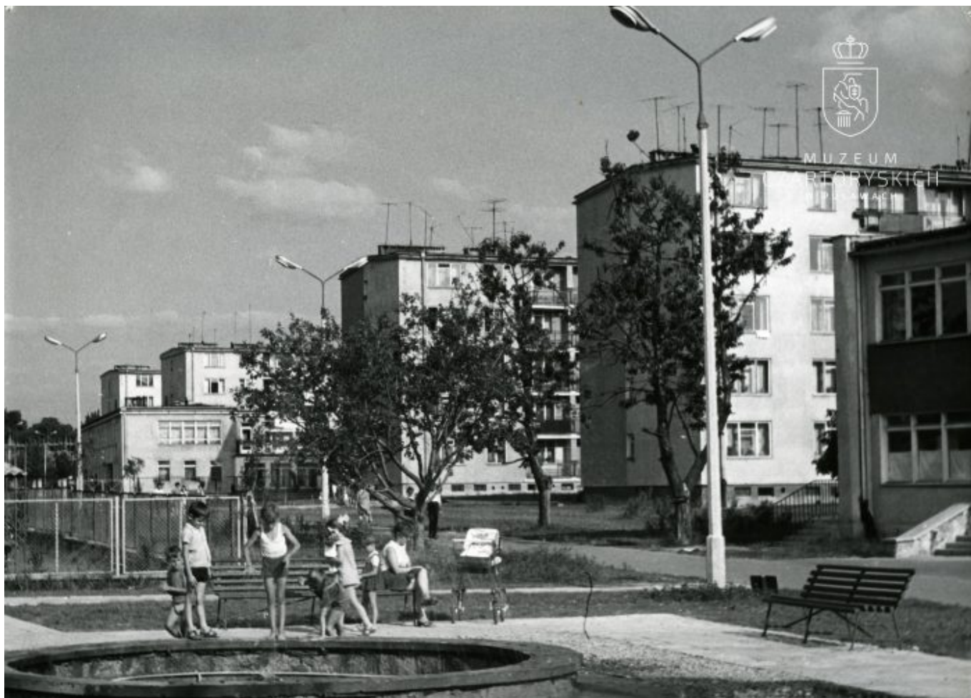
Widok na fontannę pośród nowoczesnej zabudowy miejskiej Puław, lata 70. XX w.