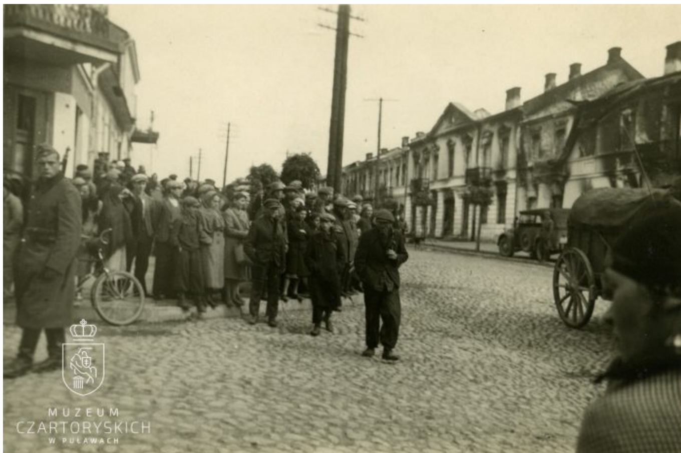
Widok na zniszczoną zabudowę miejską i zgromadzonych puławian podczas przemarszu wojsk niemieckich, 1939 r.