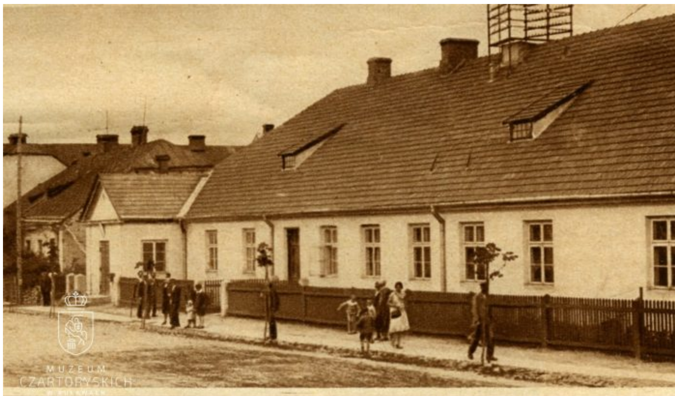
Budynek poczty w miasteczku Puławy.