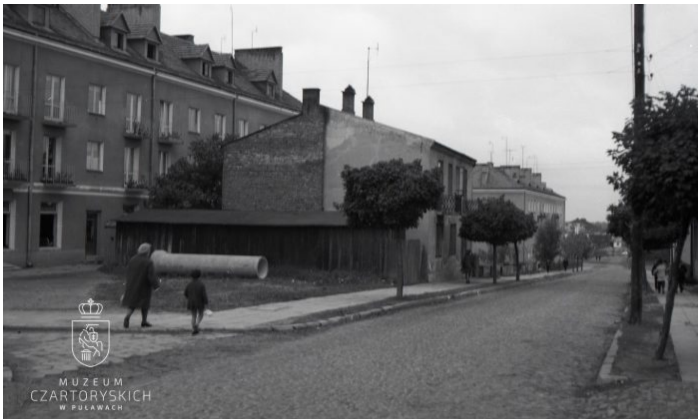
Widok na zabudowę ul. Piaskowej, lata 60. XX w.